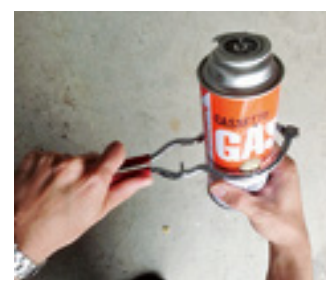
道具で穴を開けている様子

必ず中身を使い切り、屋外で穴を開けてからピンク色の指定袋(破砕する)ごみの袋に入れてごみステーションに出してください。中身が残ったままの状態です穴を開けたり、火の気があるところや、風通しの悪い屋内で穴を開けることは、非常に危険です。穴を開ける専用の道具はスーパーやホームセンター等で購入できます。