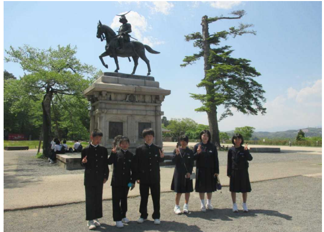
<5/10金…2年見学学習：仙台方面>