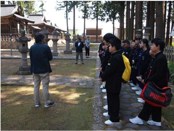
<5/10金…1年見学学習：米沢方面>