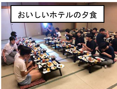
おいしいホテルの夕食