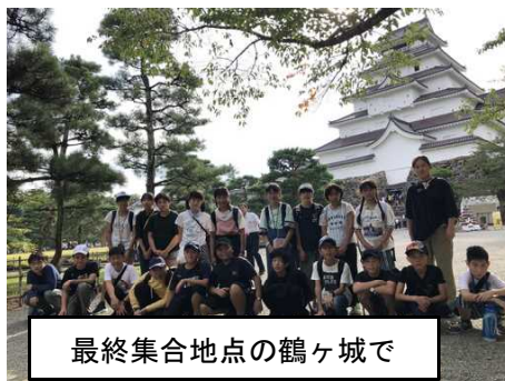
最終集合地点の鶴ヶ城で