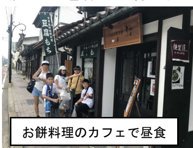
お餅料理のカフェで昼食

2日目午前は、會津藩校日新館で座禅体験を行い、午後は猪苗代湖で遊覧船に乗り、湖上から磐梯山を眺めました。