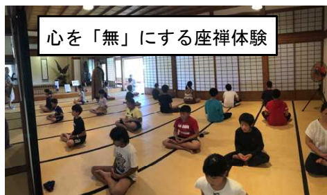
心を「無」にする座禅体験