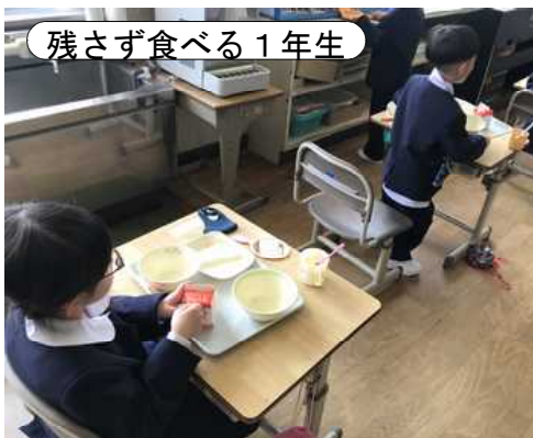
残さず食べる1年生

体育館で式に参加したのは、1年生と2年生だけでした。3～6年生は、体育館の様子を中継で見ながら各教室で参加しました。離れていても、かわいい1年生を祝う気持ちは一緒です。15名の新入生を全校児童が歓迎しました。これで、令和3年度の川崎小は全校児童106名で元気にスタートを切りました。