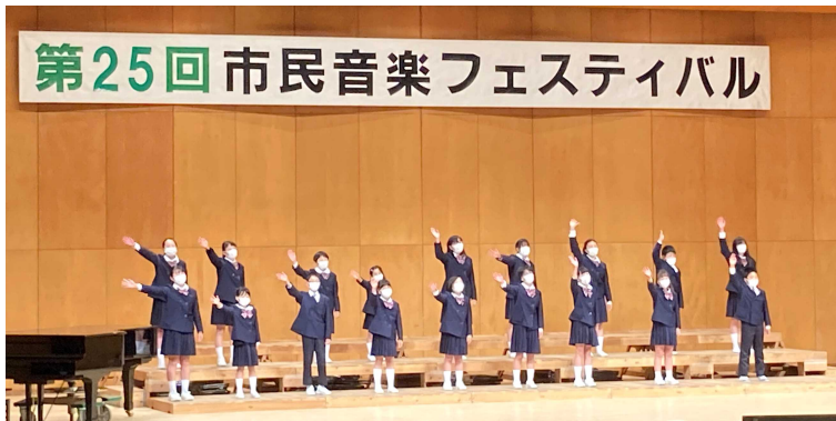
第25回 市民音楽フェスティバル