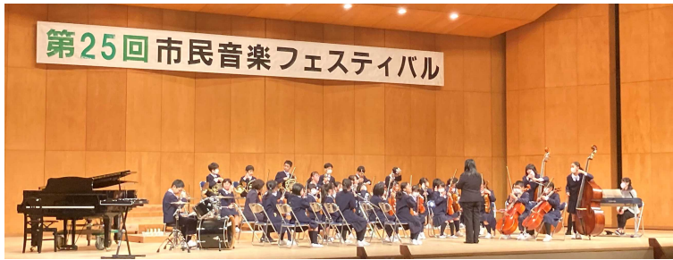
第25回 市民音楽フェスティバル