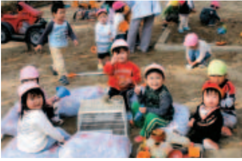
▲ 次代を担う子どもたち