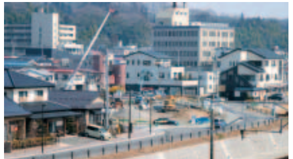
▲二本松駅前周辺整備