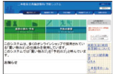
↑二本松市公共施設案内・予約システム

◎問い合わせ…生涯学習課社会教育係 ☎(55)5156 社会体育係 ☎(55)5157