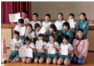
◀小学生の部優勝の旭小Aチーム