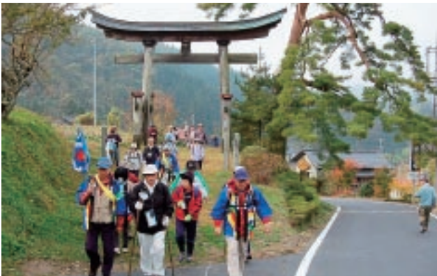
▲一の鳥居をくぐる参加者

また、お昼には地元の食材を使った郷土料理20品目がバイキング方式で提供され大変好評でした。