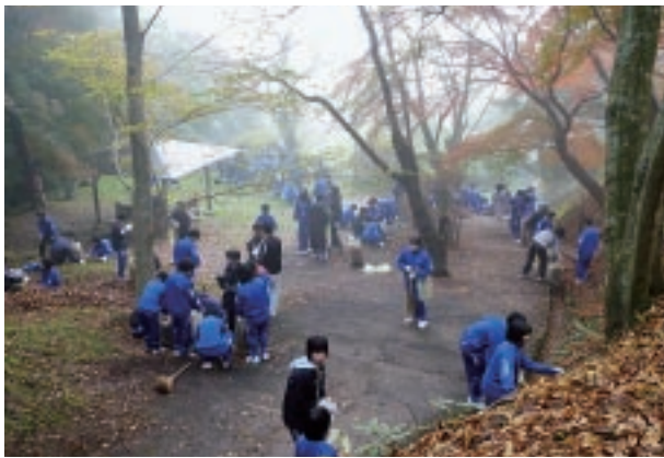
▲霞ヶ城公園傘マツ周辺を清掃する二本松一中生