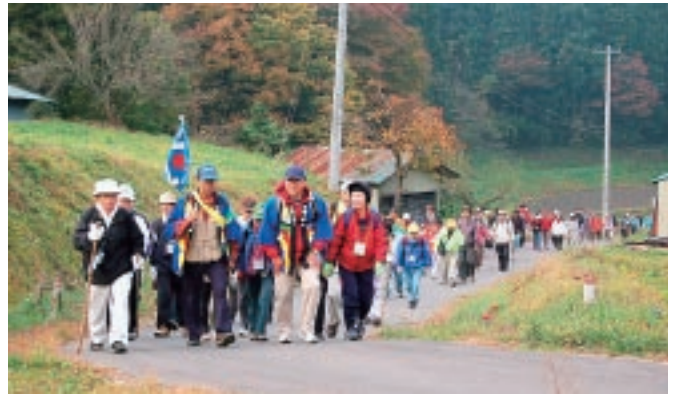
▲幡祭りのコースを歩く参加者