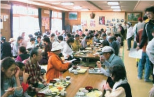
▲地元食材での昼食会