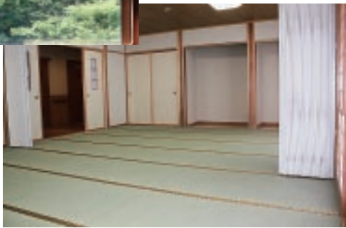
▲24畳の休憩室(2つに仕切れることも可能)