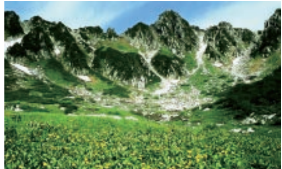
▲中央アルプス千畳敷