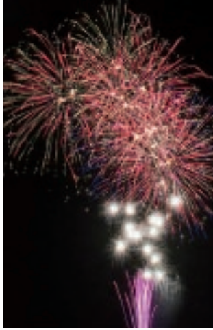
▲天竜ふるさとまつり・花火大会

市役所企画財政課、各支所地域振興課および各住民センターに備え付けの応募用紙に必要事項を記入のうえ、お申し込みください。