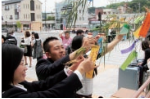
▲7月7日JICAボランティア出迎え