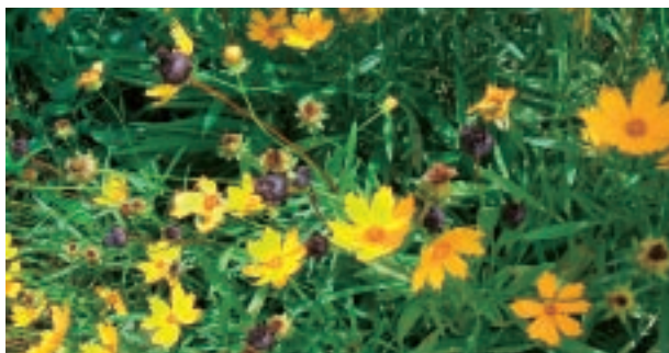
▲オオキンケイギク

コスモスに似た花で庭などに植えられているのを見かけますが、栽培が禁止されている植物ですので、増えないよう抜き取るなどしてください。