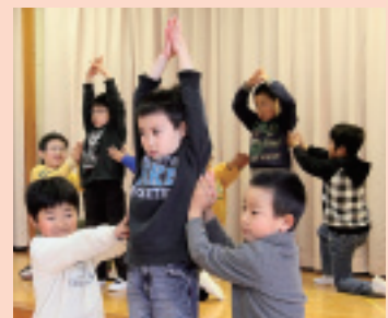
ロケットのポーズ!