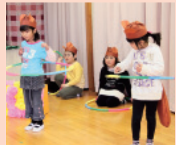
うまく回せるかな?