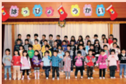
みんなそろって歌の練習!