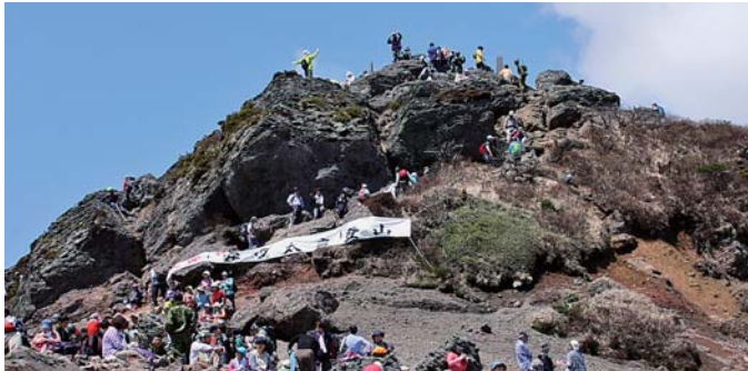
▲最高の青空を楽しむ

風も穏やかだったこの日は、親子で登山された方も多く、爽やかな初夏の一日を楽しんでいました。