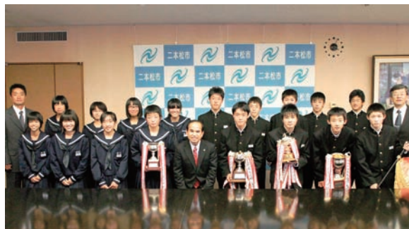
▲県大会第1位(男子)と第2位(女子)を報告

また、県大会で第1位となった男子は12月に開催される全国大会に出場が決まっており、さらなる活躍が期待されます。