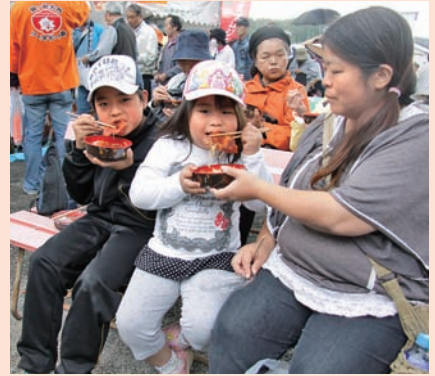
▲ソースかつ丼おいしいね!