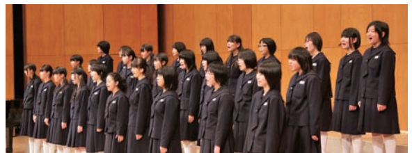
▲ 二本松第一中学校の合唱

また、鹿児島県で開催された第65回全日本合唱コンクール全国大会で銀賞を受賞した二本松第一中学校の合唱は、来場された人々に感動を届けてくれました。