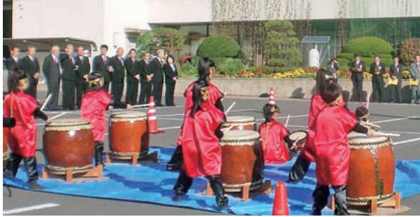
▲ 開場式を盛り上げた智恵子のふる里太鼓保存会の皆さん

11月3日・4日の両日、安達公民館と安達文化ホール、安達保健福祉センターを会場として第45回安達文化祭が盛大に開催されました。