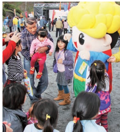
▲いつも人気者の菊松くん