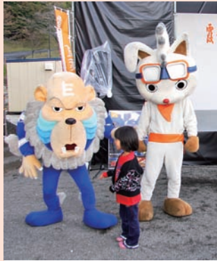
◀駒ヶ根市のキャラクター ヒッピー(左)とスピード太郎(右)も登場

ソースかつ丼は「駒ヶ根ソースかつ丼会」の皆さんから無料で提供いただいたもので二本松産米を使用したものです。準備した300食分の整理券を求め、長い列ができていました。