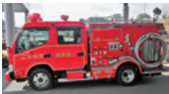
▲二本松地区隊第1分団第1部本町屯所消防ポンプ自動車