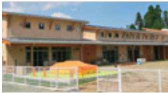
▲いわしろさくらこども園