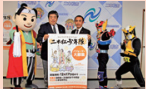
銃太郎くん、ツインウェイターとパフォーマンス集団募集を呼び掛けました。