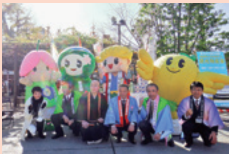
東京都の浅草にて観光物産展を開催、多くの物産品を販売しました。