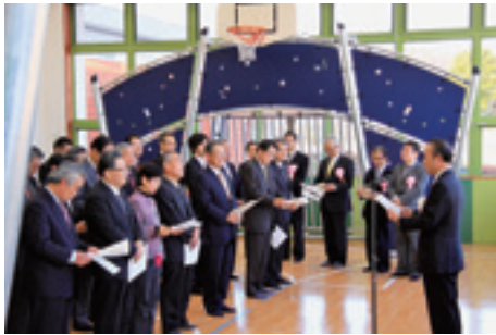
屋内遊び場を拡張、砂場などの新しい遊具が増えました。