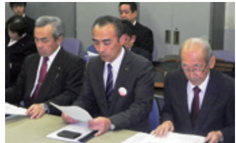
県へ道路の改良等について要望しました。