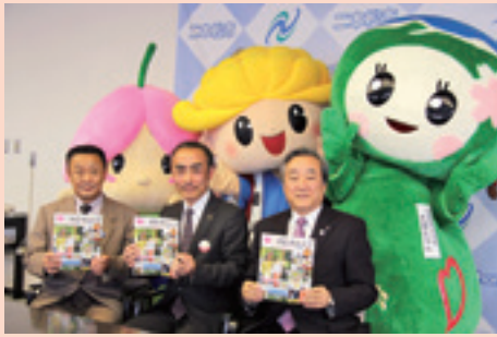
安達地方のゆるキャラたちと一緒に記者会見。魅力たっぷりの一冊で安達地方の観光をPRしていきます。