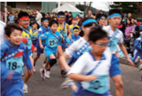
▲小学生の部46チームが元気にスタート!