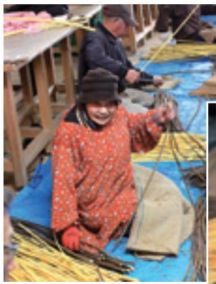
◀▼1本ずつ手作業で樹皮を剥ぐ

冬は、良質の紙を漉くことができると言われており、上川崎和紙の紙漉きも最盛期を迎えます。