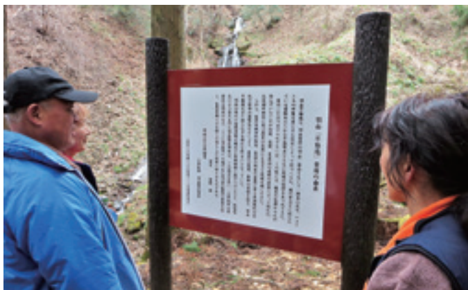
▲昨年度の取り組みの一例 針道振興会で実施した「戸沢の不動滝」整備事業