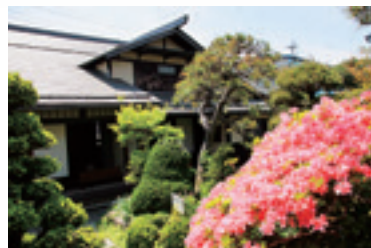
▲庭園からみた生家