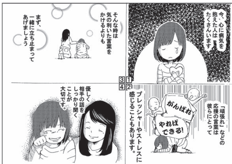
※障がいは多種多様であり、同じ障がいでひとりひとり状態が違います。このまんがの内容は一例です。