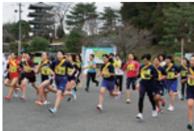
▲中学生・一般の部のスタート