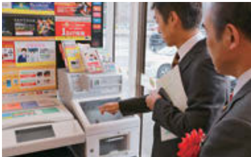
▲店内にあるマルチコピー機で簡単に操作できる

利用できる店舗は、マルチコピー機を設置している全国のセブン-イレブン、ローソン、ファミリーマート、サークルKサンクス、ミニストップとなります。