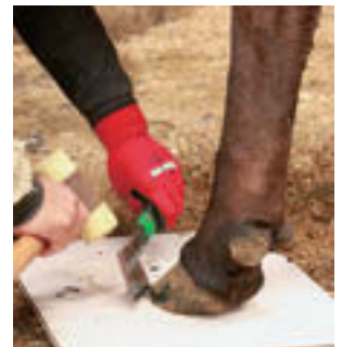
③蹄を接地させたまま、伸びた外周部分を専用のナタで切り落とす