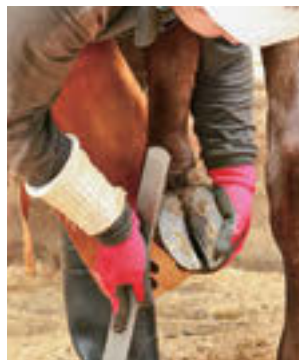
⑥最後に蹄の外周にヤスリを掛けて完成。全国大会では1人で4本の蹄を40分以内に削蹄します