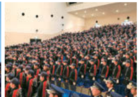
▲年頭にあたり、団員たちは市民の生命・財産を守る誓いを心新たに