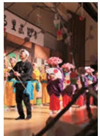
▲鈴石東町共楽会の七福神では小学生の児童も舞台上立つ(写真左)。田植踊を披露するトロミ芸能保存会(写真右)