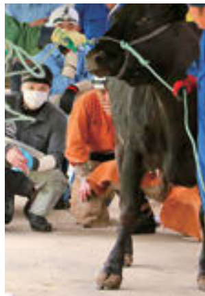
①削蹄前に牛を歩かせ、牛の立ち方や歩き方などをチェック