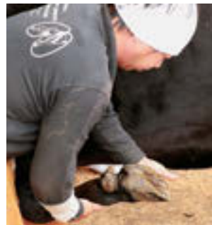
②蹄の形や疾病などをチェックし、マークシートに記入