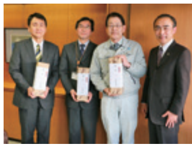
3月24日 復興庁応援職員への御礼

新規採用職員23人をはじめ、本庁各部、安達・岩代・東和各支所の代表者に辞令を交付しました。元気に明るくプロとしての仕事をしてほしいと思います。㊟