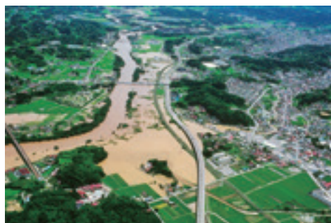
▲平成14年7月に発生した洪水(国道4号油井高架橋付近)