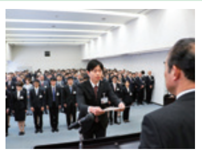
4月3日 平成29年度辞令交付式

新規採用職員23人をはじめ、本庁各部、安達・岩代・東和各支所の代表者に辞令を交付しました。元気に明るくプロとしての仕事をしてほしいと思います。㊟