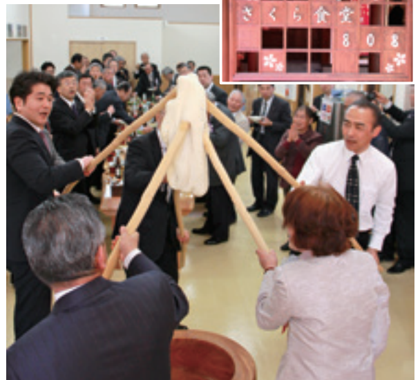
▲地元の方から寄贈いただいた臼ときねで、祝い餅つきをする市長ら。

食堂では、今までの地元産のそば粉を使用した手打ちそばに加え、地元の牧場で飼育した牛肉を使ったハンバーグも新たに登場し、大人から子どもまで楽しめるメニューとなっています。地元の方はもちろん、観光客にも親しまれる地域振興拠点の新たな門出となりました。