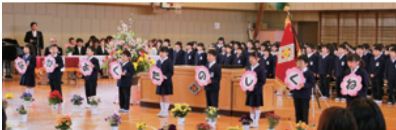
▲新2年生と5・6年生のお兄さん、お姉さんが、1年生へ歓迎の言葉(写真①)。1年生の教室で先生から名前を呼ばれると、大きな声で返事をして起立。立派な返事だったので、教室中から拍手が沸き起り、返事をした児童は少し照れ笑い(写真②)。

写真は、油井小学校の入学式と新1年生の教室の様子。この日は、喜びと緊張で埋め尽くされた校舎内でした。