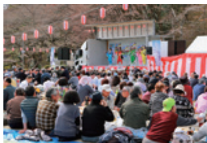
▲開花間近の桜の下で楽しむ参加者(写真①)。迫力ある和太鼓の演奏に会場もうっとり(写真②)。

二本松の観光をPRする現代版「二本松少年隊」のパフォーマンスをはじめ、上川崎の「和雅美太鼓 雅」の演奏、地酒など豪華景品が当たる抽選会なども行われ、参加者は充実した春のひとときを過ごしました。