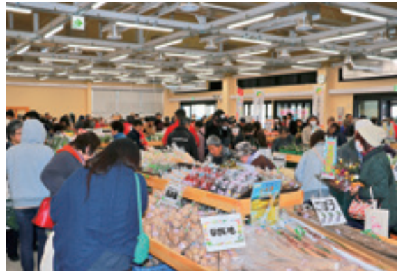
▲新鮮な青果品を求め、大勢のお客さまでにぎわう店内

J Aふくしま未来の「こらんしょ市二本松店」が3月16日、市内杉田駄子内で新装開店しました。同店舗は老朽化のため、昨年6月から立て替え工事が進められていました。新店舗の売り場面積は464.81㎡で、旧店舗のおよそ1.5倍の面積を確保しています。オープンした店内には、安達地域管内で生産された新鮮な野菜をはじめ、新たに豆腐工房と米飯工房の2つの加工施設を設けたことにより、地元産の原料を使った豆腐や巻き寿司、おこわなどが製造販売され、開店と同時に店内はお客さまで埋め尽くされました。