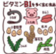
残暑バテ予防に効果的な食品