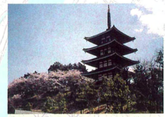
安達ヶ原ふるさと村

本久寺 慶安2年(1649)日相和尚が開山。本堂南東に大きく傾斜した土手際に寛永20年(1643)植樹と伝える市指定天然記念物シダレザクラの古木。