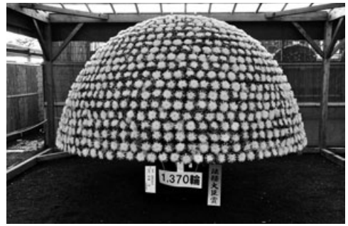
見事な千輪咲きの菊