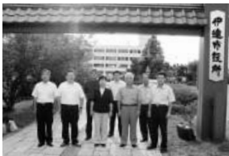
「伊達市役所庁舎前」

いずれも、地域の資源や特性を十分に理解し活用を図りながら特色ある施策を展開しており、参考とすべき点の多い視察でした。