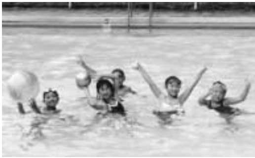
水遊びする子供たち（新殿プール）

問 市営小浜・旭プールは今後も一般市民の利用が可能か。 教育部長 今後も現行どおりの管理運営で利用いたたくことと考えているが、現在施設使用料の在り方を検討しており、プール使用料についても