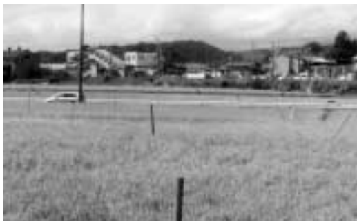
動き出す安達駅東地区開発

建設部長 ①地元協議にもよるが土地区画整理事業による整備は難しく、一体的総合的計画の下、各公共施設（道路、駅前広場等）の整備を進めるのが最善と考える。②連絡橋設置は開発協議会等の協議により基本構想策定の中で検討する。費用は市が負担することになる。③基本構想策定の中で、十分検討する。