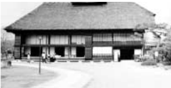
ふるさと村公園内：古民家

産業部長 ふるさと館（レストラン、物産売店等）の収益事業に関しては、市ふるさと振興公社の独立採算制による管理とし、所管は観光課である。ふるさと村広場公園部分は、既存の安達ヶ原公園と一