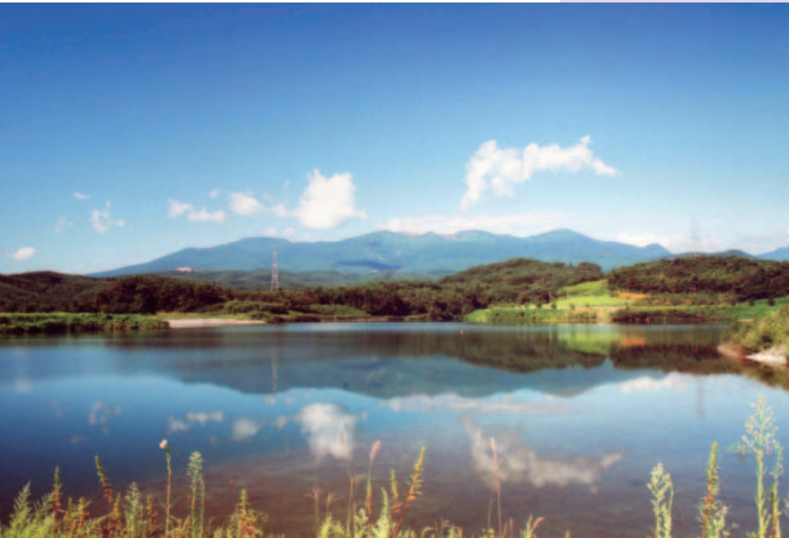
初秋のあだち湖（安達地域）