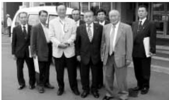
「江別市役所庁舎前」

今回の視察先は、観光・まちづくり等行政の諸問題に取り組む四市町であり、学ぶべき点が多い視察でした。