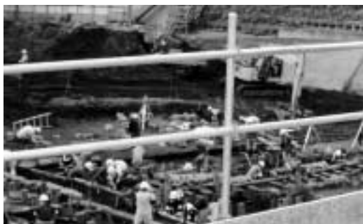
江戸上屋敷の発掘調査風景

教育長 発掘は最終段階であり、屋敷の境界石垣について衆議院から東京都を通じて二本松市に譲渡したい旨の打診があり、旧二本松藩江戸上屋敷の歴史的所産であることから、石垣の一部百三十個ほどの石材を譲り受ける今回の運搬費用として計上した。今後の活用については、歴史資料館における展示、霞ヶ城公園整備や公共施設へ利活用する。