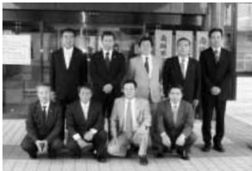
「南砺市役所庁舎前」

一宮市は、納税環境の改善の視点からコンビニ納税に取り組んでいます。より身近で便利なコンビニエンスストアで納税が可能となることで納税者の利便性と収納率の向上につながるものと考えます。