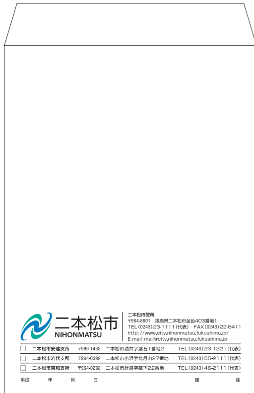
角形2号/タテ240×332mm (3色刷り)