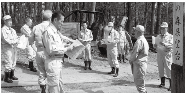
現地調査の様子（市民の森）