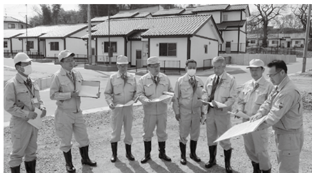
現地調査の様子（市営住宅茶園団地）

町内会等からの代表者によるワークショップを重ねている。複合施設は、1階が物販スペース、2階が歴史資料展示スペースの構想で協議を進めている。