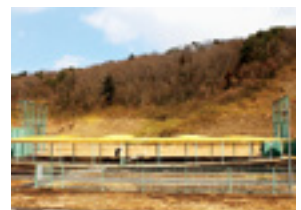
二本松市総合射撃場

◎問い合わせ…生涯学習課スポーツ推進係 ☎(62)7067 Fax(22)7171