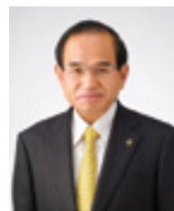
二本松市長 三保 恵一

人生百年時代を生きる。 二本松に暮らすすべての人々が元気はつらつ、生きがいを持って人生を送る。