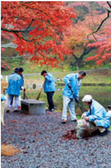
昨年の清掃の様子