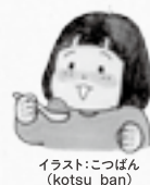
イラスト:こつばん (kotsu_ban)

※初回限定、一世帯一回限り。※生活クラブをご利用されていない方が対象です。※お届けの際、生活クラブの説明をさせていただきます。