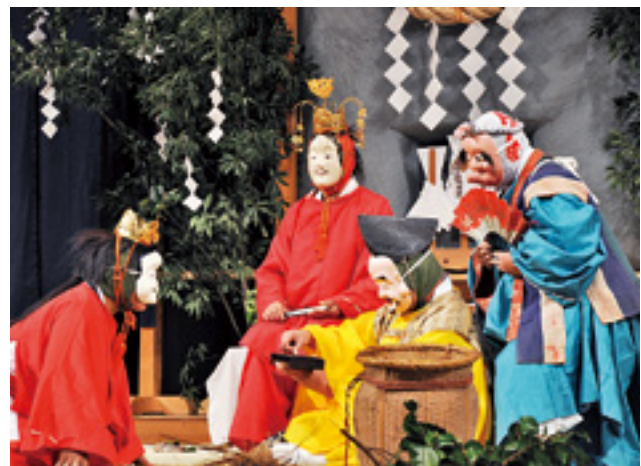
蚕養舞(白鳥神社太々神楽保存会)