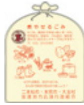
▲燃やせるごみの指定袋