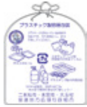
▲マークのついたきれいなプラスチック製容器包装の指定袋