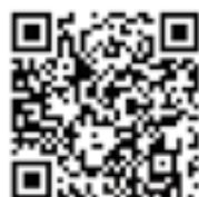
成人式申込QRコード