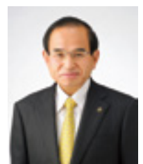
二本松市長 三保 忠一

新型コロナウイルスが、爆発的に感染拡大しております。「市民の命を守る。」ことを最優先に、「感染防止」「生活を守る」「経済再生」を3つの柱に全力を尽くしてまいります。