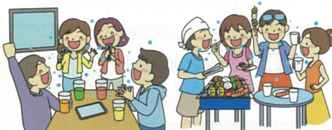
Conversation without a mask ますく かいわ マスクなしでの会話