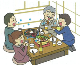
Social gatherings with drinking alcohol さけのあつ お酒を飲む集まり