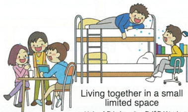
Living together in a small limited space せまくらかん きょうどうせいかつ 狭い空間での共同生活