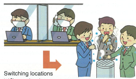
Switching locations いばしょ きか 居場所の切り替わり