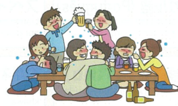
Long feasts in large groups おおにんずうなが じかん いんしよく 大人数や長い時間の飲食