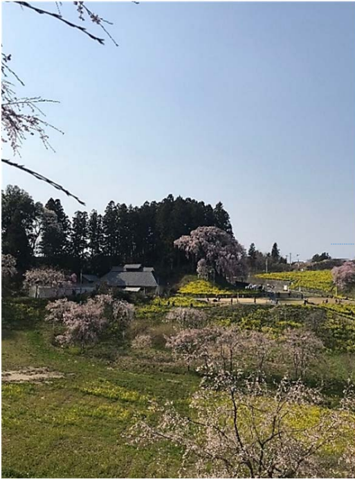
上と右上／合戦場の桜をさくら回廊から眺めるのがおすすめ。里山の春景色に時間を忘れそうです

もうすぐ岩代にも桜の季節到来です。今回はよく名の知られた一本桜ではなく、散策やドライブを楽しめる桜並木やお花見スポットをセレクトしました。