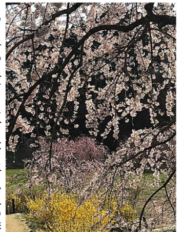
上／レンギョウや春の花もいっぱい

●散策コース／杉沢の大杉～三渡神社 ●見どころ／樹齢千年ともいわれる大杉の周辺には、公園を囲むように桜の木もたくさん。雄大な杉の巨木と桜のコントラストを楽し