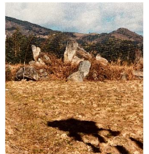
上／百目木城庭園の庭石。現在は雑木林に覆われ、月は見えにくくなっています