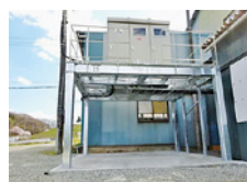
溶融亜鉛メッキ架台製作