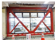
鉄骨枠付耐震ブレース

建築金物、一般住宅、鉄骨階段、工場・倉庫新設はもとより公共工事(市立小中学校・県立高校)と大小問わず、また、県内外施工させていただいています。