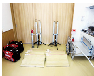
根崎地区自主防災会

宝くじの社会貢献広報事業として、宝くじの受託事業収入を財源として実施しているコミュニティ助成事業を活用し、根崎地区自主防災会では発電機などの防災活動備品を、藤町町内会ではお祭りで使用する太鼓や提灯などを整備しました。