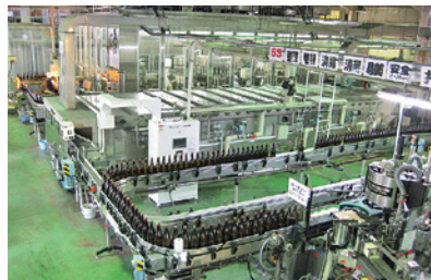
パストライザーによる瓶詰めライン