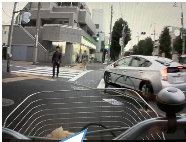
②自転車通行帯を渡ろうとしています

ああ、ねむい。きのうの夜ゲームしすぎた……。あれ、なんかブレーキの効きがわるいなあ。あ、そういえばライトもきれっていたような……。