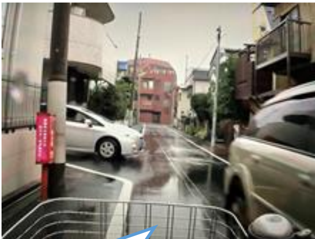
①信号のない、せまい道を急いでいます

時間におくれちゃう、いそがなきゃ。 待っているだろうな……。ん、車きたけど……。今なら行けるかも！