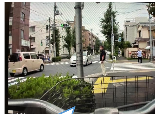
③楽しみにしていたゲームの発売で頭がいっぱいです

テスト終わった！やっとゲームができる。 ゲームの発売日だ！店にいそごう！あれ、 なんかチェーン外れそうな感じ……。