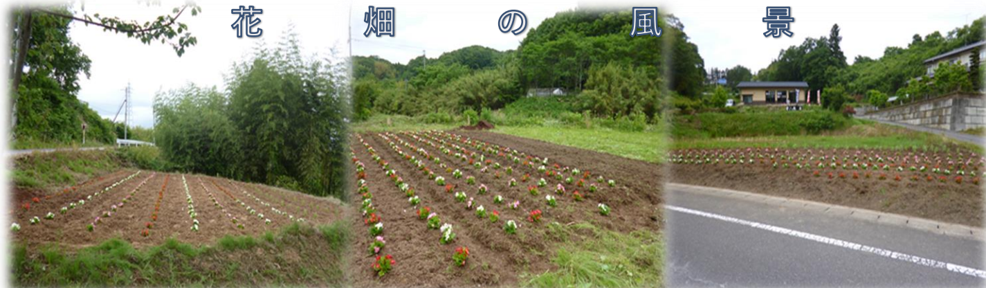
荒井 (荒井公園付近)