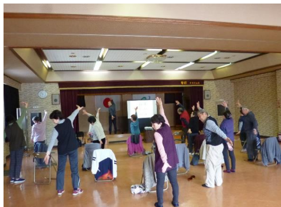
新殿地区（参加者 約13名）