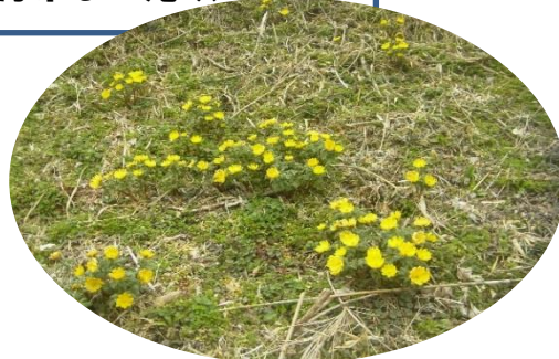
与太郎内地内の福寿草群生地