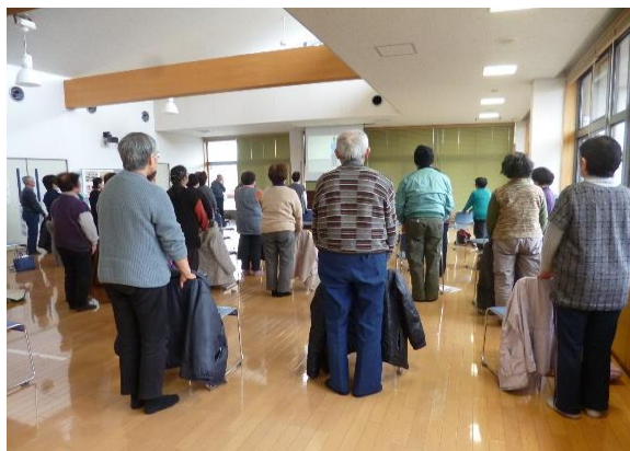
小浜地区（参加者 約40名）