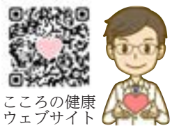
こころの健康ウェブ 사이트

市では、悩みや不安などを伺いながら、ご本人やご家族の相談に応じています。また、必要に応じて、医療機関やさまざまな分野の方と一緒に支援していきます。