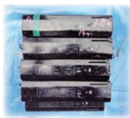
照明器具の安定器

また、期間内に処分しない場合には、行政処分や刑罰の対象となる可能性があります。PCBとは：ポリ塩化ビフェニルの略称で油状の化学物質です。