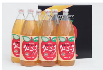
10 羽山りんごジュース

チーズケーキ工房 風花 バスクチーズケーキ4号(12cm) なめらかで甘いくちどけが特徴 の、濃厚なチーズケーキです。