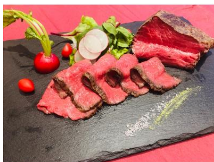
13二本松市産黒毛和牛ローストビーフ450g

黒毛和牛ローストビーフ450g(2本 合計) ※ローストビーフソース、レフォール、 わさび塩付きです。製造後急速 冷凍しております。