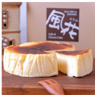
11 バスクチーズケーキ

チーズケーキ工房 風花 バスクチーズケーキ4号(12cm) なめらかで甘いくちどけが特徴 の、濃厚なチーズケーキです。