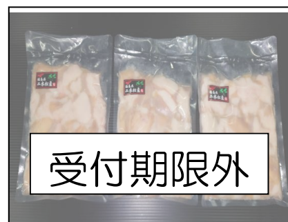
12二本松市産黒毛和牛もつ鍋用ホルモン1.5kg

黒毛和牛ローストビーフ450g(2本 合計) ※ローストビーフソース、レフォール、 わさび塩付きです。製造後急速 冷凍しております。