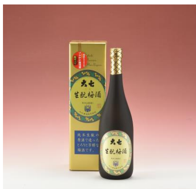
14 大七酒造 生酏梅酒

安齋食品/田楽串おでん(1袋) 人気酒造/青人気吟醸(720ml) 檜物屋酒造店/千功成純米酒 (720ml)