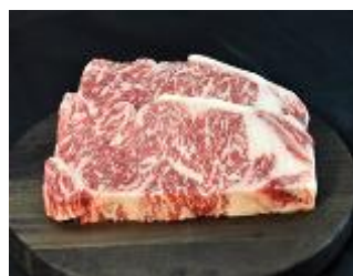
16 二本松市産黒毛和牛サーロインステーキ300g

黒毛和牛うすぎり 1kg(500g×2パ ック)※厳選した二本松市産黒毛和 牛のモモ、バラをうすぎりにカット しました。すき焼き、焼肉とさま ざまな用途でお使い頂けます。