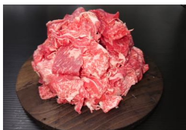
17二本松市産黒毛和牛うすぎり1kg

黒毛和牛もつ鍋用ホルモン 1.5kg(500g×3袋) ※二本松市産黒毛和牛もつ(小腸) を使用しています。500gずつパ ックして冷凍しております。