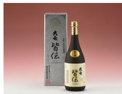
15 大七純米吟醸皆伝

黒毛和牛サーロインステーキ(150g ×2枚)※厳選した二本松市産黒毛 和牛のサーロインをステーキ用にカ ット。ご家庭でご堪能ください。