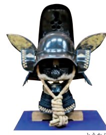
伝丹羽光重公愛用唐冠兜

◎問い合わせ…二本松歴史館 ☎(22)3220 Fax(22)3228 文化課文化振興係 ☎(55)5154 Fax(23)1326