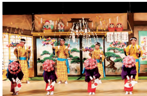
石井の田植踊(石井芸能保存会)