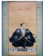
祖父・丹羽長秀公